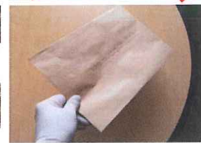
Balissage de l'accès